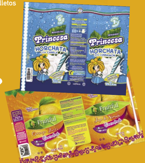
Etiquetas / nuevas marcas