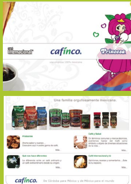
Sito web / microsities

Como ejemplo reciente de redacción, puede visitar el sitio de internet www.cafinco.com y allí encontrará variedad de formas lingüísticas que nuestro equipo de redacción ha elaborado.