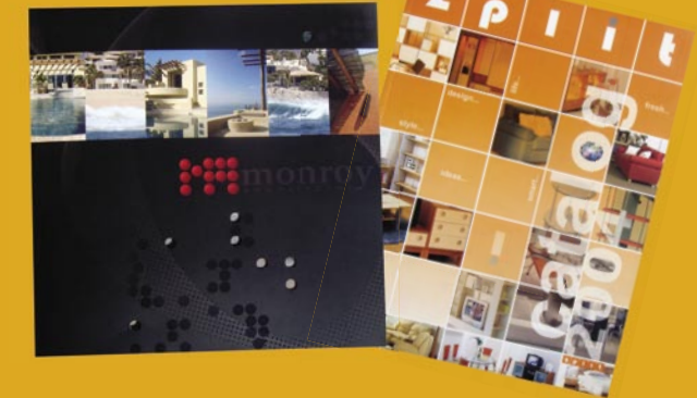
Catálogos / folletos