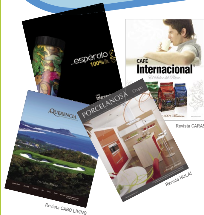
Anuncios publicitarios y de revista