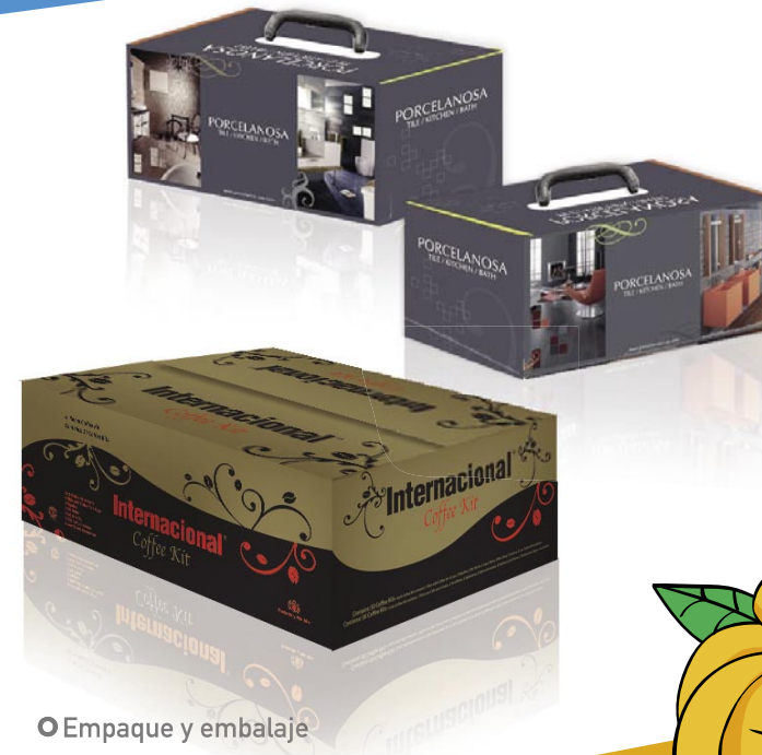
Empaque y embalaje