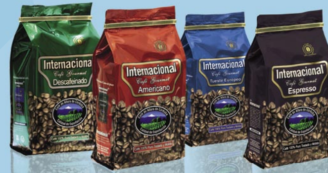
Diseño de producto