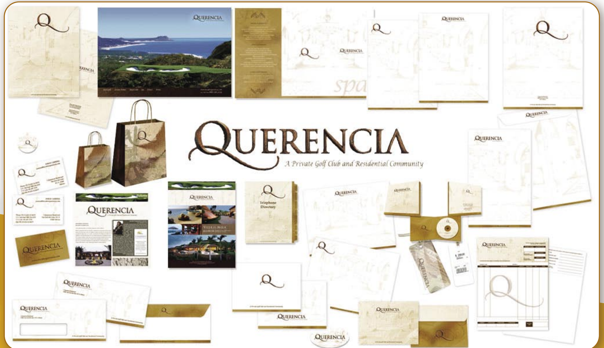
○ Imagen corporativa