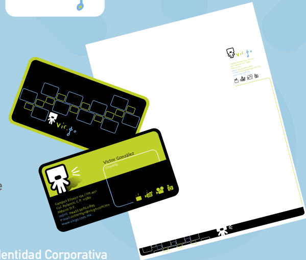
Branding e Identidad Corporativa

Realización de un plan detallado para la ejecución de una acción o una idea.