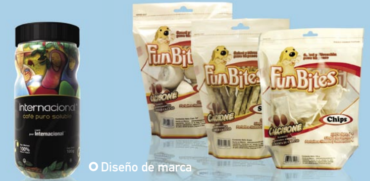
Diseño de marca